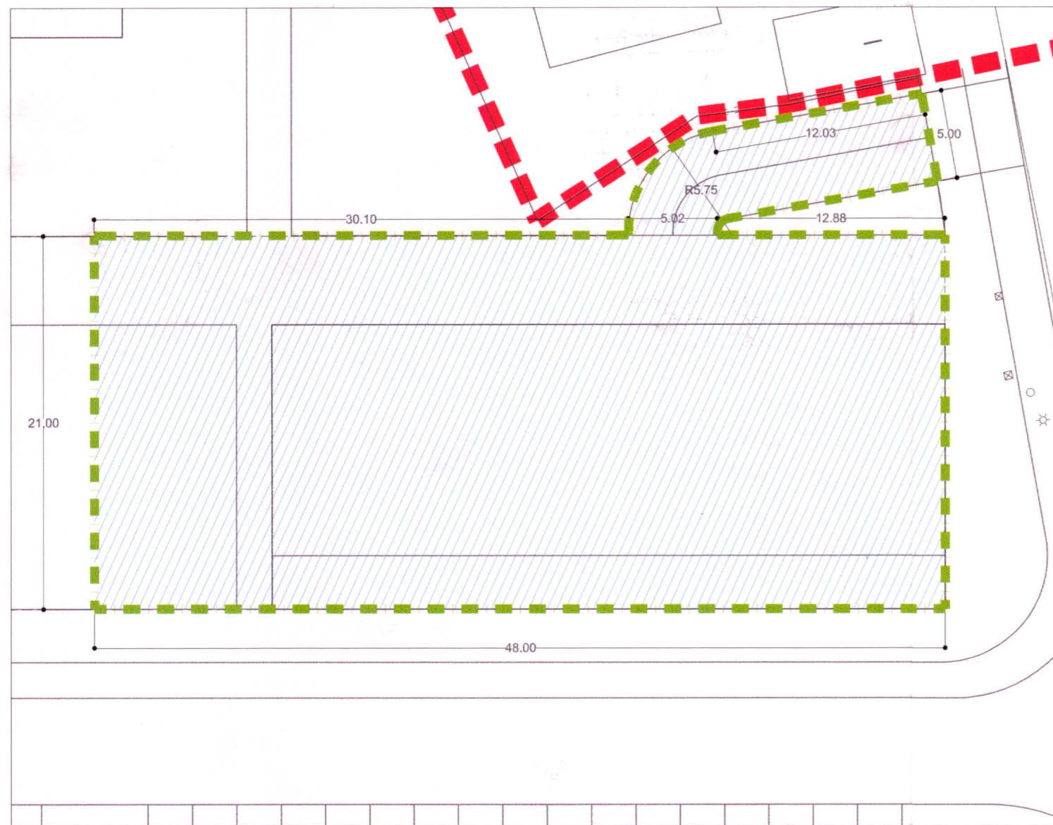
EDIFICACION BAJO RASANTE PARCELA 3 E 1/300